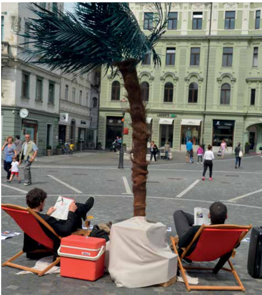
Pop-up davčna oaza v središču Ljubljane – intervencija v javnem prostoru

N evladne organizacije iz Evrope, Afrike in Južne Amerike so se v okviru projekta Gibanje za davčno pravičnost, ki ga sofinancira Generalni direktorat za razvoj in sodelovanje Evropske komisije, povezale z namenom ozaveščanja o pomenu pravičnih globalnih davčnih politik, ki so eden izmed dejavnikov za doseganje in zagotavljanje človekovih pravic tako v razvitih državah kot tudi – in